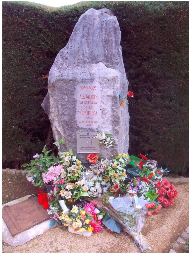
Monument situat a la fossa comuna del cementiri de Girona, en memòria als morts en defensa de la República (1939-1945), fet el 1981 per l'Ajuntament de Girona. També hi ha una placa commemorativa de la Creu de Sant Jordi que els va ser lliurada l'any 2006.