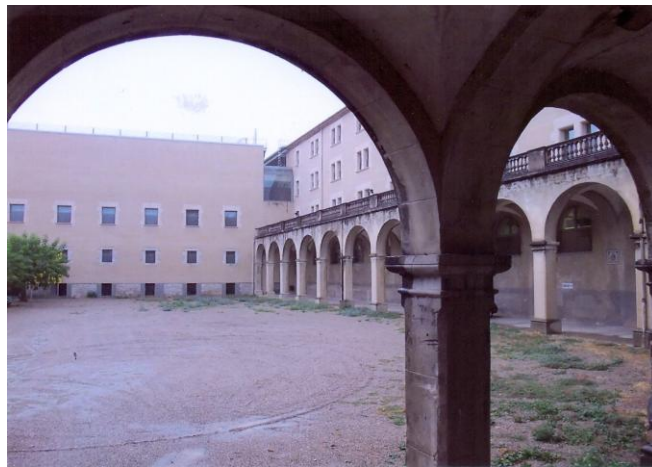
Pati de la Presó Seminari de Girona.