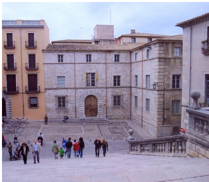
L'edifici del centre, que fins el setembre de 2012 ha estat la seu de l'Audiència Provincial de Girona, era el lloc on es celebraven els Consells de Guerra.